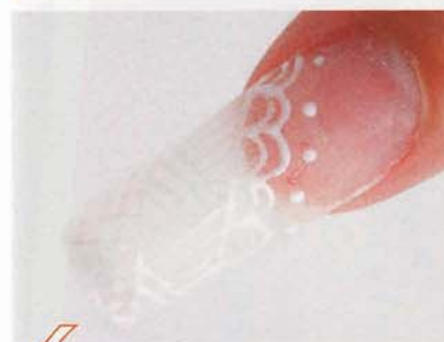
6 Cのホワイトジェルでレースの模様を描き、硬化させる。