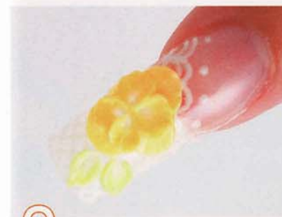
9 Eのグリーンジェルで、葉っぱを作る。