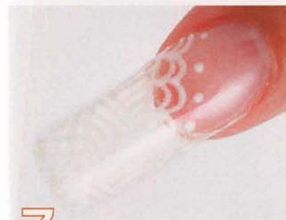
7 Bのハードジェルを塗布して硬化させ、クリーナーで未硬化ジェルを拭き取る。