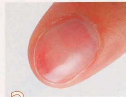
2 ネイルベッドにAのクリアジェルを塗る。