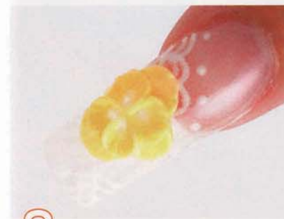
8 Dのイエロークリームジェルで、お花を作る。