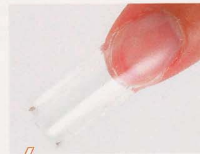
4 UVライトで仮硬化後、フォームをはずし、ピンチを入れる。