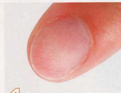
1 プレパレーションをする。