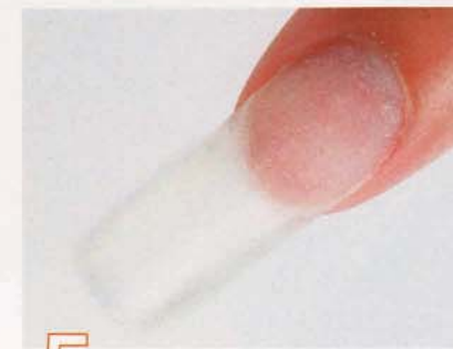
5 ファイルで形成し、表面をサンディング。ダストオフ後ネイルブレップを塗布。